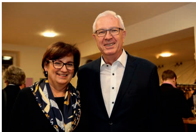
■ Mezi hosty v divadle byl senátor Jiří Drahoš s manželkou.