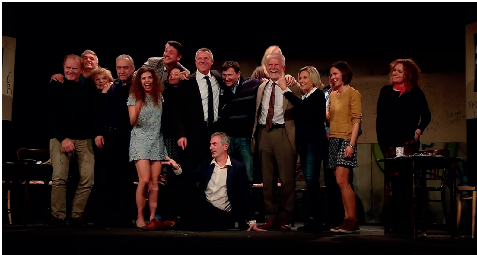
■ Herci Divadla Na Jezerce a jejich hosté měli radost z nadšeného publika.