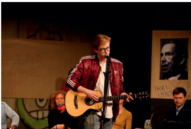
■ Zahrál a zazpíval Adam Mišík.